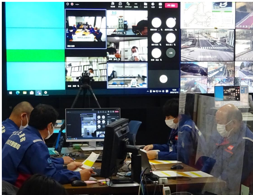
令和4年度の訓練状況