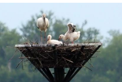
渡良瀬遊水地第2調節池 4年連続コウノトリの 野生繁殖成功