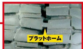
残り溝深さが「プラットホーム」に達していると冬用タイヤとして使用できません。

最も早い初積雪日 関東 平成29年 長野市 11月21日 中部 令和3年 高山市 11月27日