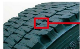
プラットホームとは新品時の溝深さから50%の位置にあるゴムの盛り上げりを設置した部分。