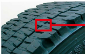
プラットホームとは新品時の溝深さから50%の位置にあるゴムの盛り上がりを設置した部分。