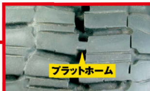
残り溝深さが「プラットホーム」に達している冬用タイヤとして使用できません。