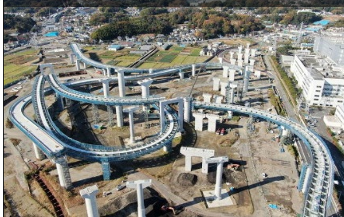
圏央道（神奈川県区間） 横浜環状南線 栄IC・JCT