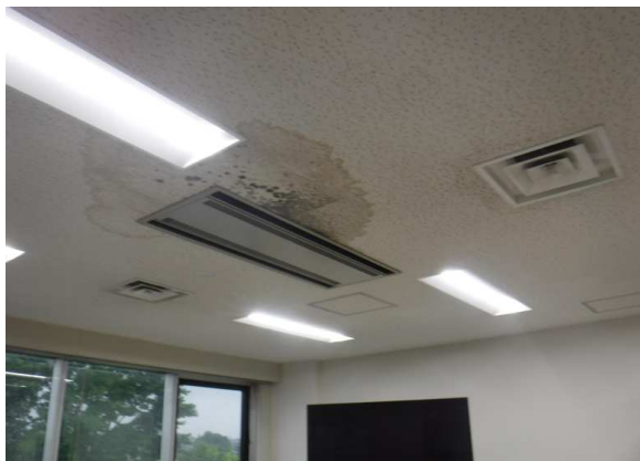
室内状況（第二会議室）