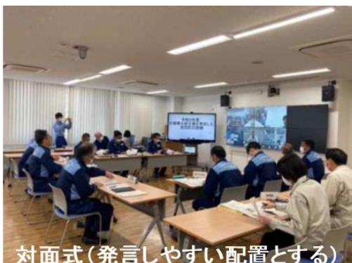
【写真 訓練実施イメージ】