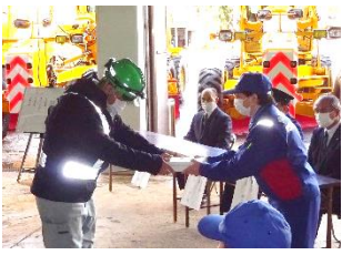
鍵の引渡し 除雪車両の鍵を各除雪作業受注者へ引渡し。