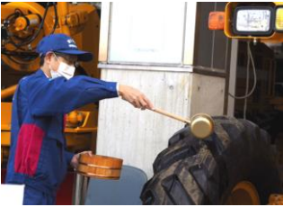
安全祈願 野尻湖の水で車両を清め、除雪作業の安全を祈願。