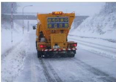
凍結防止剤散布車 路面の凍結を防ぐために凍結防止剤を散布する除雪車両です。