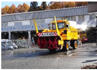
除雪車両出動 ロータリ除雪車をはじめ、各除雪車両が除雪ステーションより出動。