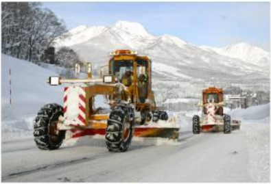
除雪グレーダ 主に新雪を路肩にかき寄せ、車道を確認するための除雪車両です。