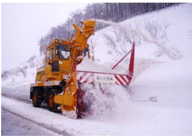
ロータリ除雪車 路肩にたまった雪を取り除き、車道を拡幅するための除雪車両です。