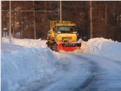
平成26年2月豪雪時 長野県軽井沢地先の国道18号