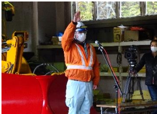
決意表明 参加者を前に、決意表明を行う各除雪作業受注者の代表者。