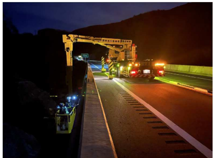
橋梁点検車による点検のイメージ写真 中部横断自動車道の点検時の写真です。