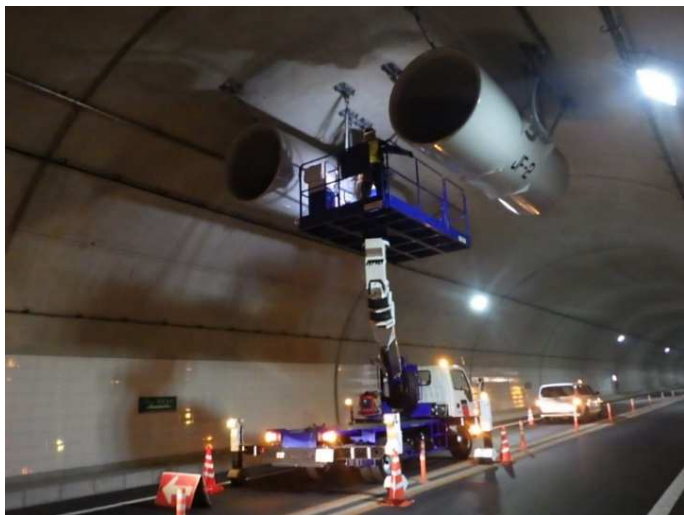
高所作業車によるトンネル設備点検のイメージ写真 中部横断自動車道の点検時の写真です。