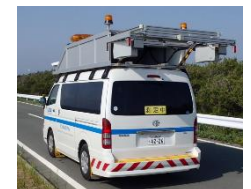
3次元レーザーセンサ を用いた舗装損傷検知