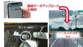
スマートフォンやドライブレコーダー による舗装損傷検知