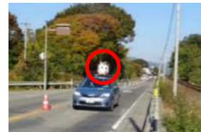
車載装置による路面性状測定