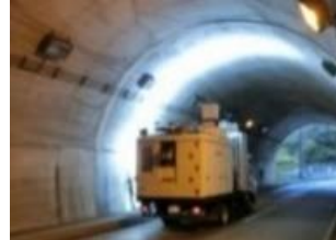
レーザースキャンによる変状把握