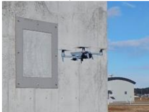
ドローンによる損傷把握