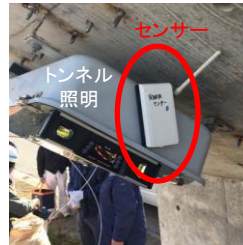
トンネル内附属物の 異常監視センサー