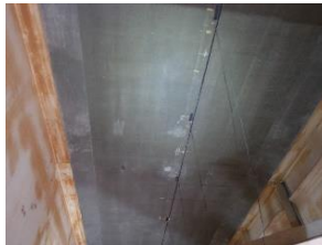
光ファイバーセンサーによる 橋梁モニタリング