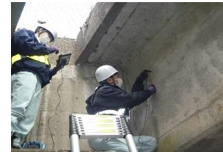
AEセンサを利用した PCグラウト充填把握