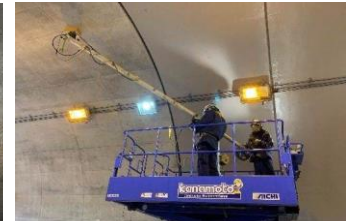
レーダーを利用した トンネル覆工の変状把握