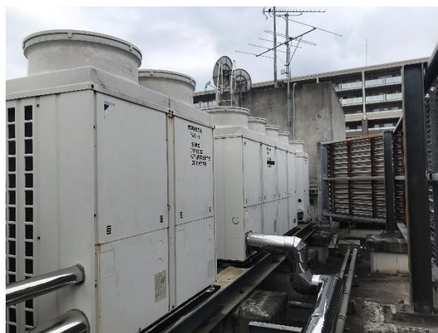
既設空調室外機 (屋上)