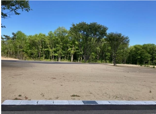
トイレ棟 位置 (南面より)