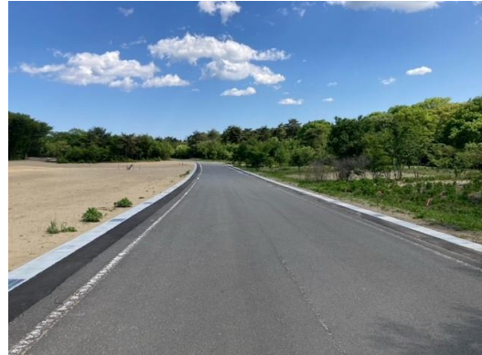
トイレ棟 (敷地前面道路)