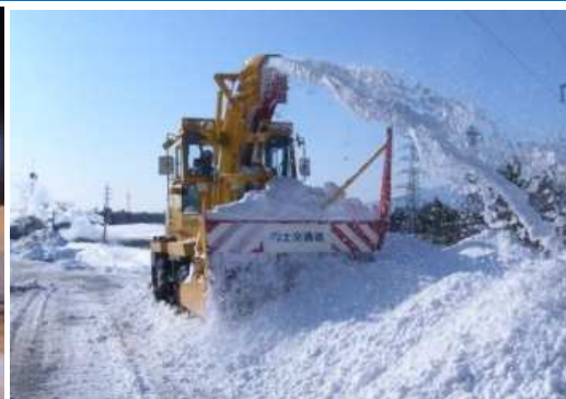
ロータリー除雪車

雪を路肩にかき寄せ、車道を確保する目的で使用する除雪機械です。この車両を主力として除雪作業を行います。