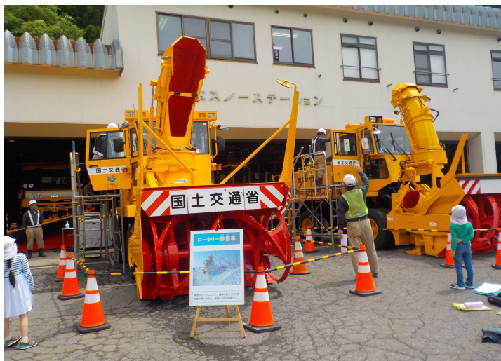
除雪機械乗車・操作体験