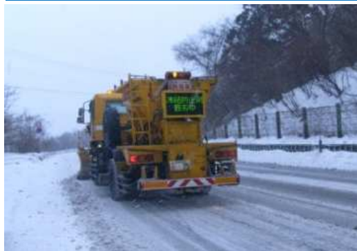
凍結防止剤散布車

凍結防止剤を散布し、路面の凍結を防ぐ目的で使用する除雪機械です。冬期における走行車両の安全性を向上させます。