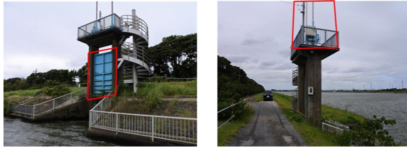
日川第二水門 施工範囲