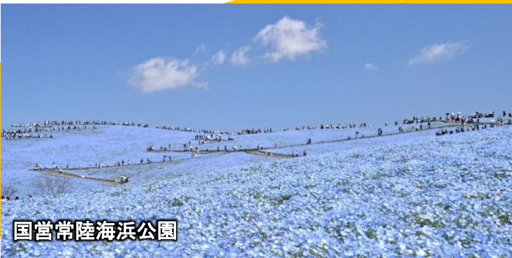
国営常陸海浜公園