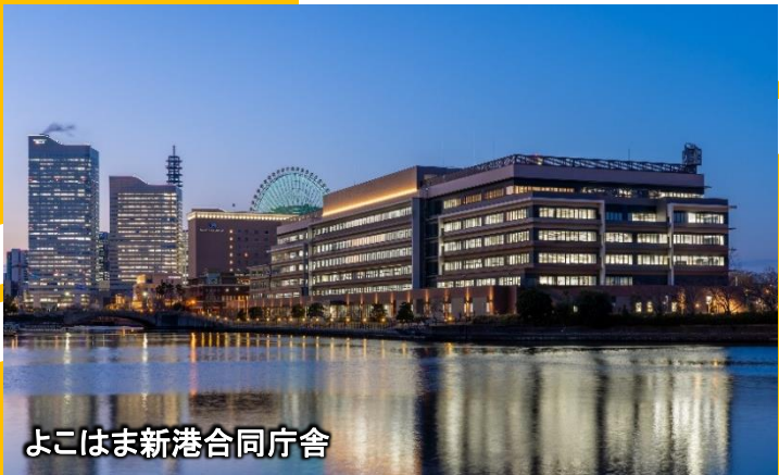
よこはま新港合同庁舎

「スキルアップセミナー関東」は、昭和35年(1960年)に「関東建設技術研究発表会」として建設局(当時)職員や自治体、関係団体等の職員の方々の業務に関する技術の向上、アカウンタビリティを果たすために必要な能力の向上及び業務推進に対する研究、創意工夫等の推進を目的として始まり、平成12年(2000年)関東地方整備局の誕生とともに「スキルアップセミナー関東」と名称を改め、現在に至っております。