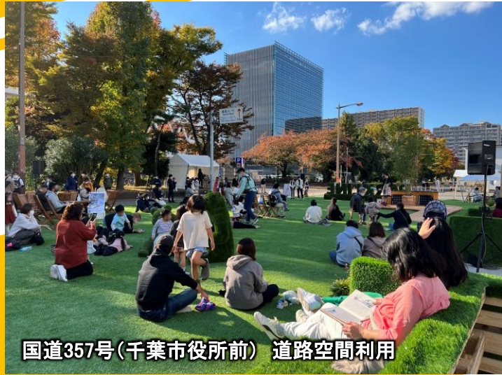
国道357号(千葉市役所前) 道路空間利用