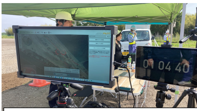
1時間を超える長時間レーザー点群測量に成功