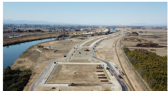
実証実験現場(荒川第二調節池予定地)