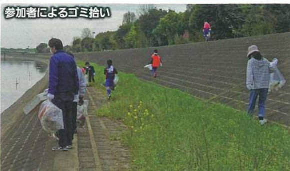
参加者によるゴミ拾い