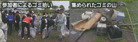
集められたゴミの山