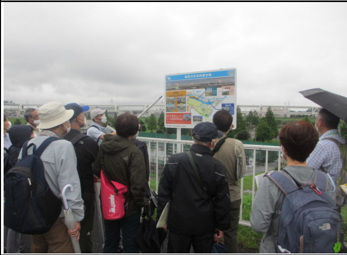
鶴見川流域センター付近を見学