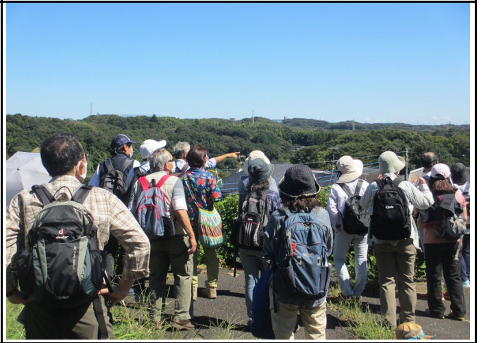
鶴見川みつやせせらぎ公園付近を散策