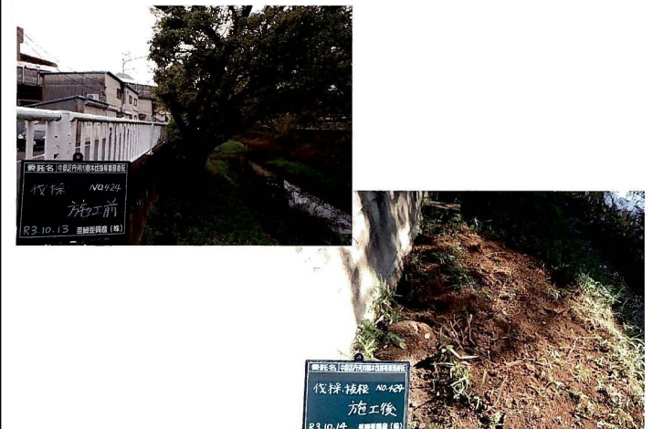
河川樹木 伐採・除根