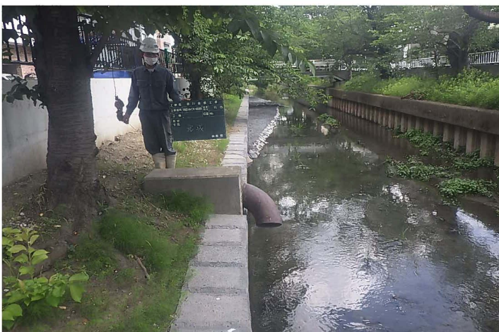
河川改修工事 施工後