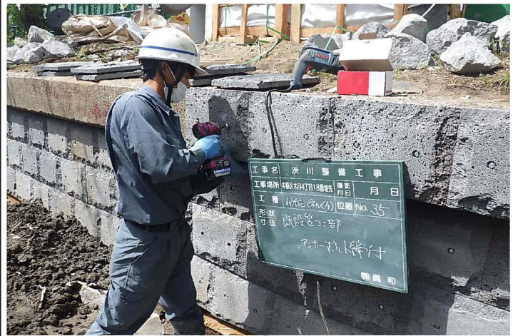
河川改修工事 施工中