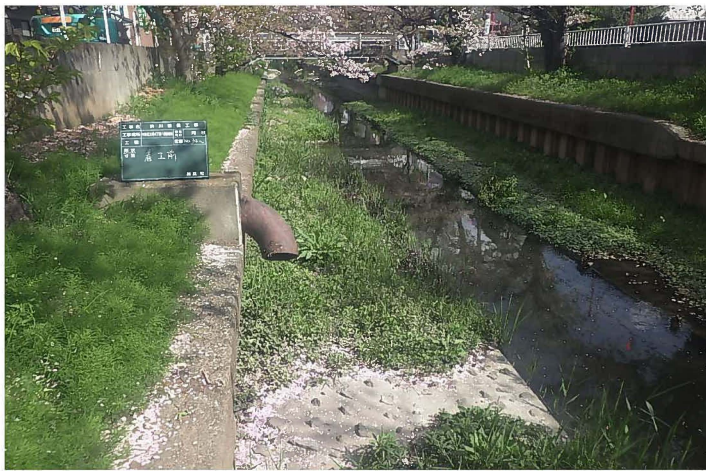
河川改修工事 施工前