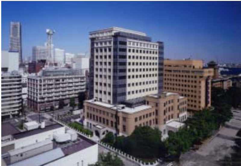
(横浜地方・簡易裁判所)