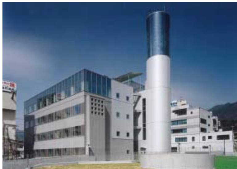
(飯田第2地方合同庁舎)