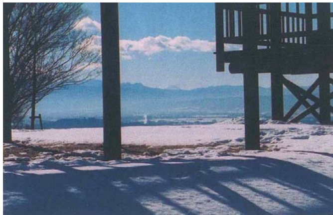
飯綱山公園 歴史の広場（富士見城跡）