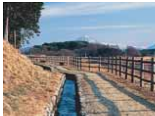
八反歩水路・遊歩道