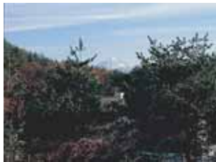
生涯学習センターこぶちさわ前庭