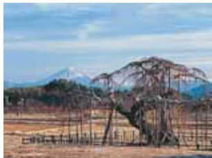
神田の大イトザクラ