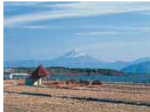
花パーク フィオーレ小淵沢