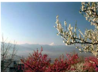
笛吹川フルーツ公園