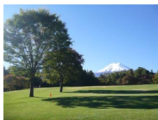
諏訪の森自然公園 (富士パインズパーク)