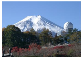
富士山レーダードームと富士