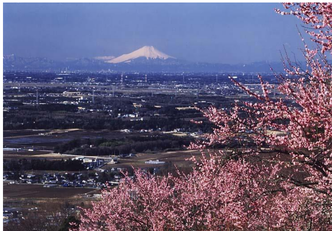
つくば市筑波 筑波山