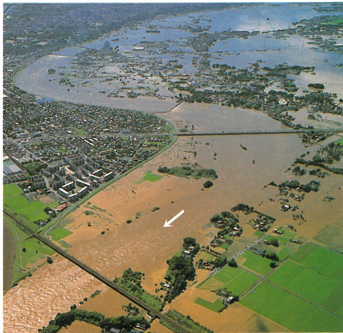
昭和61年8月台風第10号出水時