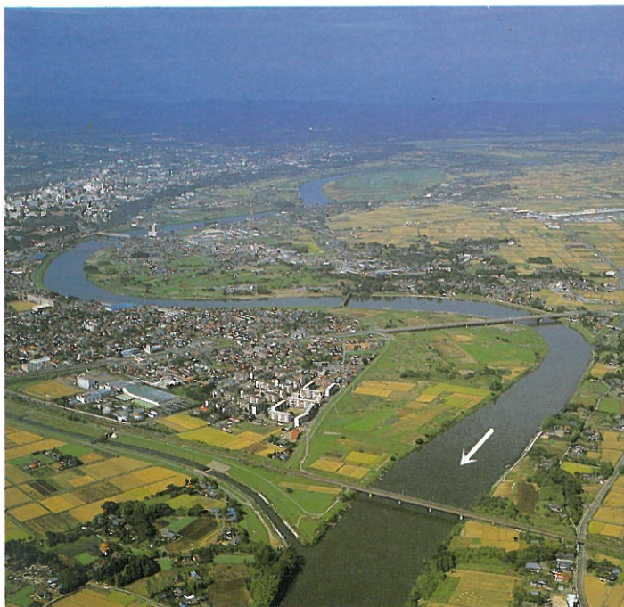
平常時（昭和61年9月撮影）