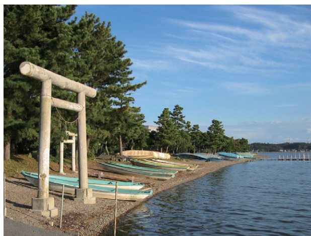
水戸八景の一つ潤沼 ひろうら 広浦の風景（茨城町）