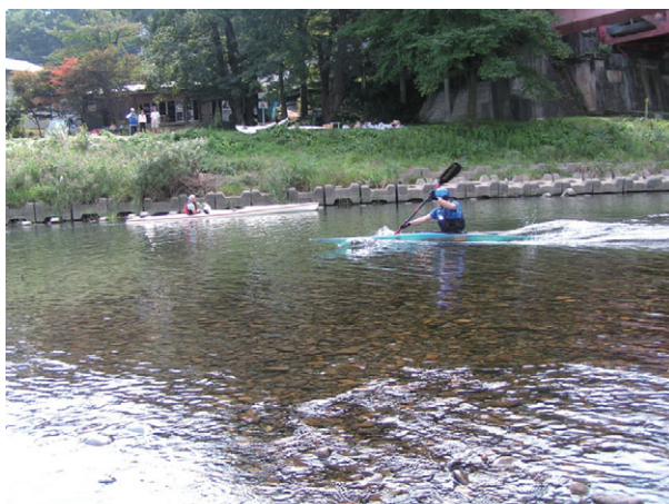
カヌー（那珂川大橋周辺 茨城県常陸大宮市）