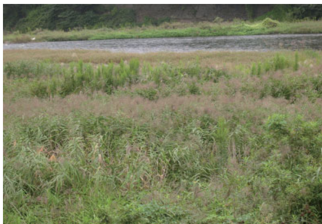
中流域に多いツルヨシ群落