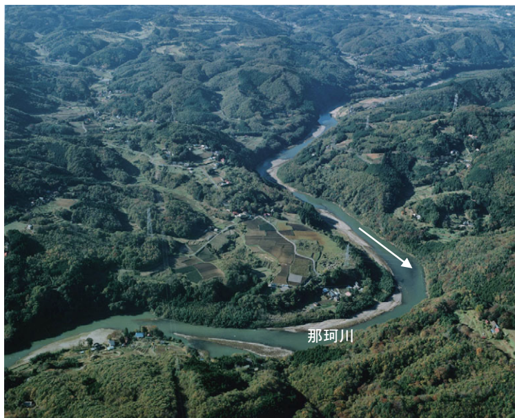
八溝山地を横断する那珂川（河口から55.0km、茂木町、平成15年11月）