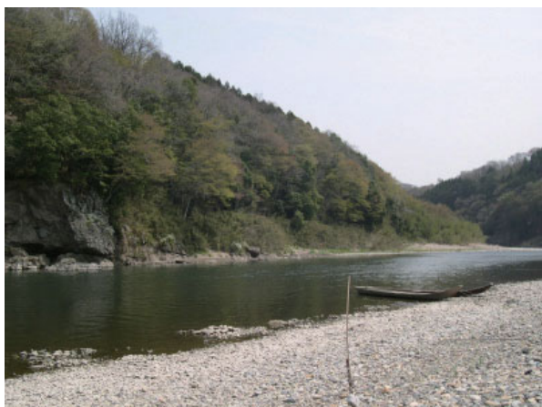
中流域に特徴的な斜面林と砂礫河原（茂木町 4月）

豊かな那珂川の流れは、良好な水質を維持し、砂州の入れ替わりによって瀬が良好な状態に維持されており、流水にすむ淡水魚や水生昆虫が生息する。春から夏にかけてはアユが遡上する。