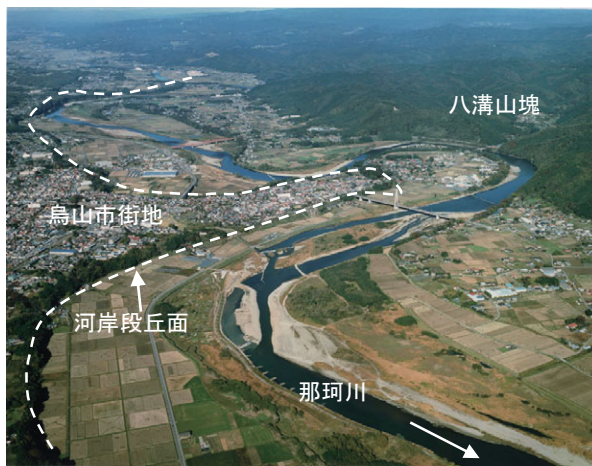
那珂川の河岸段丘

八溝山塊、鷲子山塊の西側を南へ流下する区域（箒川合流点～下野大橋）では、河岸段丘が発達し、その間に幅2～3kmの谷底平野が開け、水田の多い地域となっている。さらに下流の八溝山地を横断する区域（下野大橋～御前山）では、両側が崖地となり、崖地特有の植生が見られる。八溝山地西麓には部分的に暖温帯に見られる照葉樹林が分布し、河川に面した崖地でも照葉樹林が一部見られる。さらに下って、茨城県内に入ると川幅が拡大して再び数段の段丘地形が見られる。