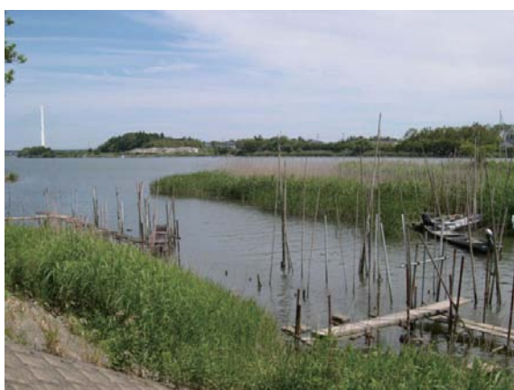
那珂川下流（ひたちなか市 6月）