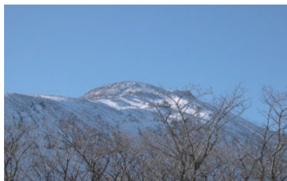
那須岳（茶臼岳）（那須町 1月）