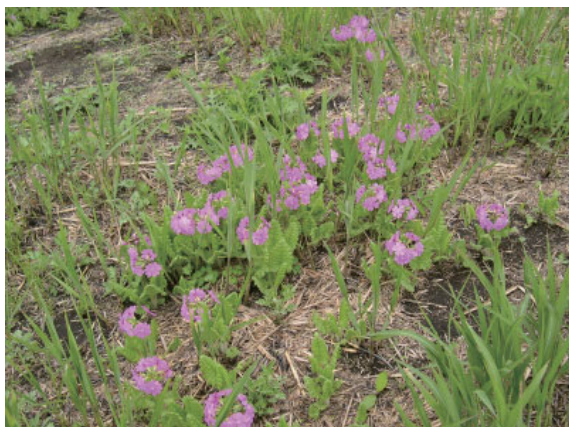
那須高原に咲くサクラソウ（那須町 5月）