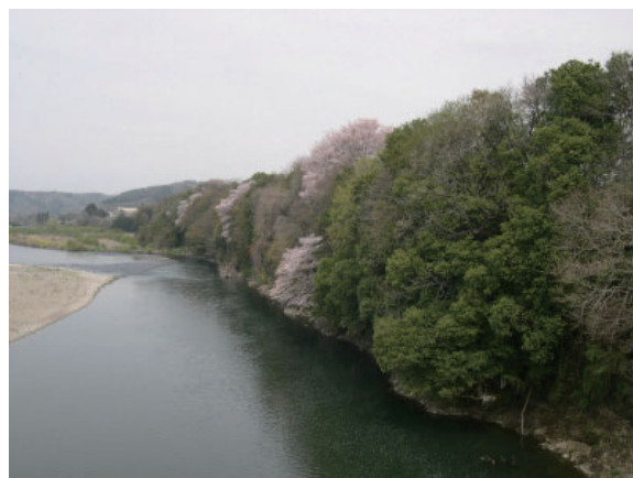
那珂川中流（茂木町 4月，大瀬橋より）