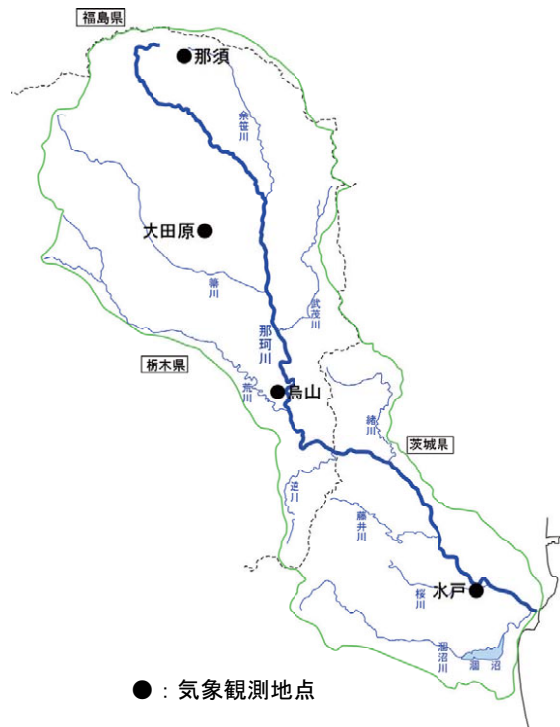
図1-4 那珂川流域の気象観測地点

年平均降水量（平成7年～平成16年の平均）は、大田原1,555mm、烏山1,345mm、水戸1,310mmとなっており、関東地方の年平均降水量1,550mm、日本の年平均降水量1,718mm（昭和46年～平成12年の平均『日本の水資源』）に比較して少ないが、源流部の那須（那須岳）では2,065mmの降水がある。