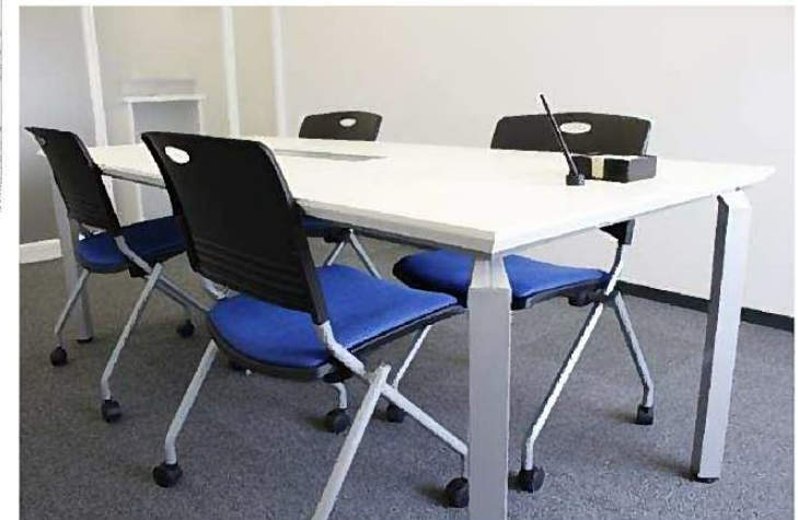
相談ブースのイメージ