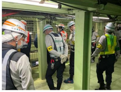
受発注者合同のパトロール（令和7年11月28日）