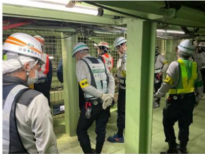
受発注者合同のパトロール（令和7年11月28日）