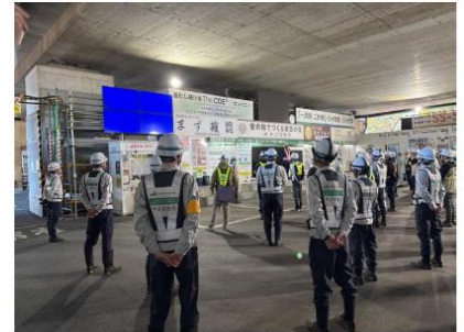
受注者の安全大会（令和7年11月4日）