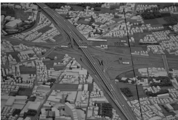
▲中央ジャンクション(仮称)周辺の立体模型