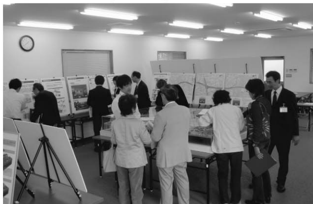
▲みなさんからのご相談やご質問には、担当者が個々に対応致します