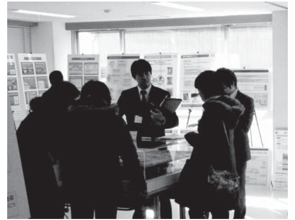
▲みなさんからのご相談やご質問には、担当者が個々に対応いたします。

※ 駐車場を用意しておりませんので、お車での来場はご遠慮ください。 ※ 会場のある区市以外の方もご来場頂けます。