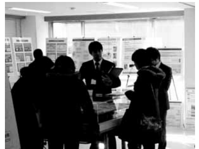
▲みなさんからのご相談やご質問には、担当者が個々に対応いたします。