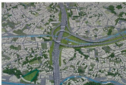
▲東名ジャンクション(仮称)周辺の立体模型