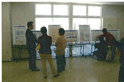
▲みなさんからのご相談やご質問には、担当者が個々に対応致します