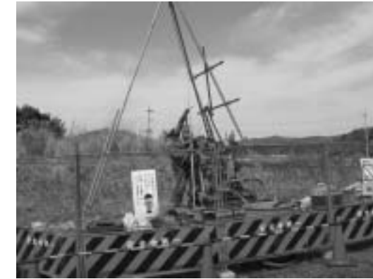
< ボーリング調査方法 >