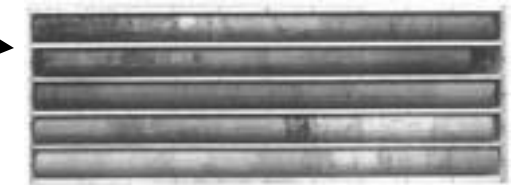
< ボーリングコア採取状況 >