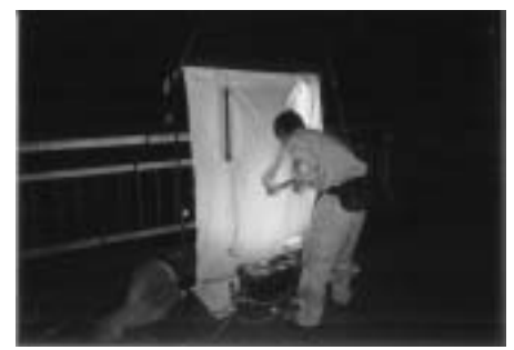
ライトトラップ (ライトを点灯し、集まってくる夜行性昆虫類を採集します。また、街灯のたくさんある場所では、街灯に集まる夜行性昆虫類を採集します。)