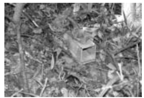
ネズミ類捕獲調査用のワナ (間口 8cm x 9cm の筒状のワナ)