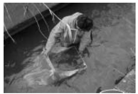
サーバーネットによる底生生物調査 (水生昆虫やエビ類等を採集します)