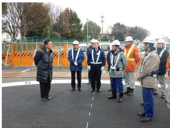
保坂区長からのご挨拶