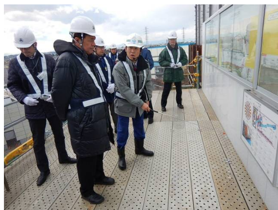
見学台における視察