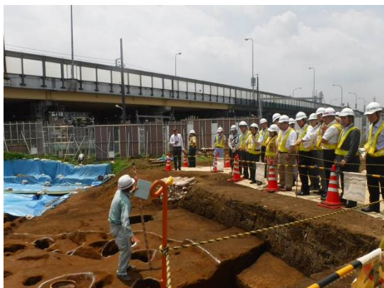
説明状況(埋蔵文化財調査)