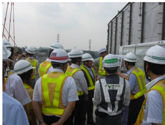
説明状況(見学台・東名JCT)