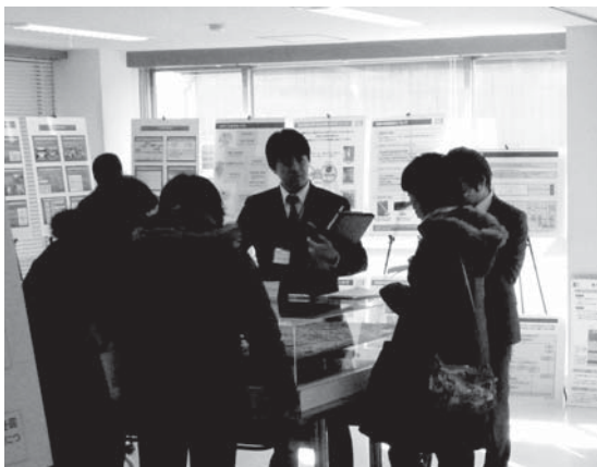
▲みなさんからのご相談やご質問には、担当者が個々に対応いたします。