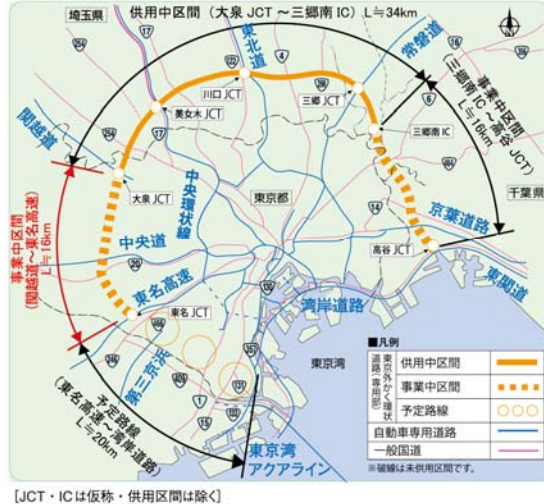
全体計画と幹線道路網図