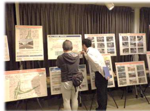
みなさんからのご相談やご質問には、 担当者が個々に対応いたします。