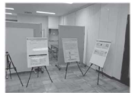
個別ブースにて事業に必要な箇所に 土地をお持ちの方のご相談を承ります。