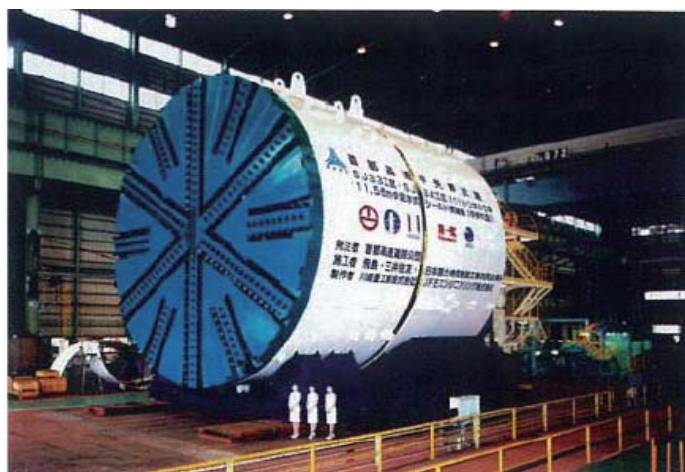
シールドマシンの例