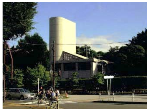
換気所の例 (国道20号新宿御苑トンネル新宿御苑換気所)

浮遊粒子状物質(SPM)を高効率で除去可能な除じん装置について、換気施設に設置することを検討します。