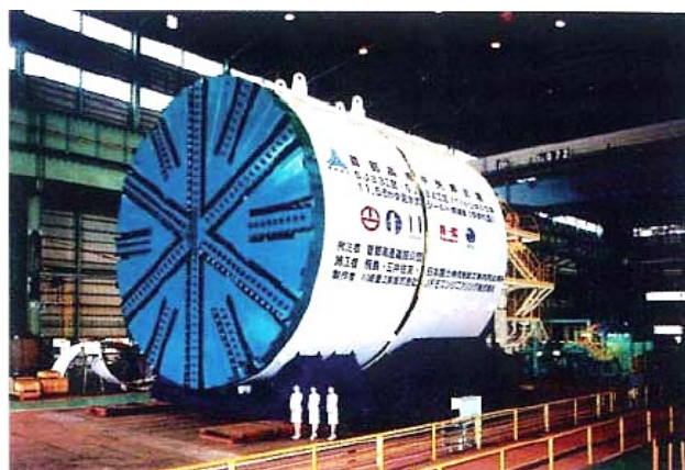
シールドマシンの例