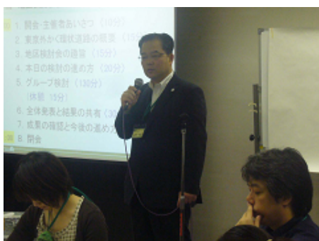
(写真2) 地元行政を代表して、世田谷区道路整備部長より挨拶