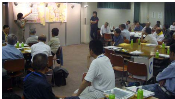
(写真3) 各グループの検討結果を進行役から報告