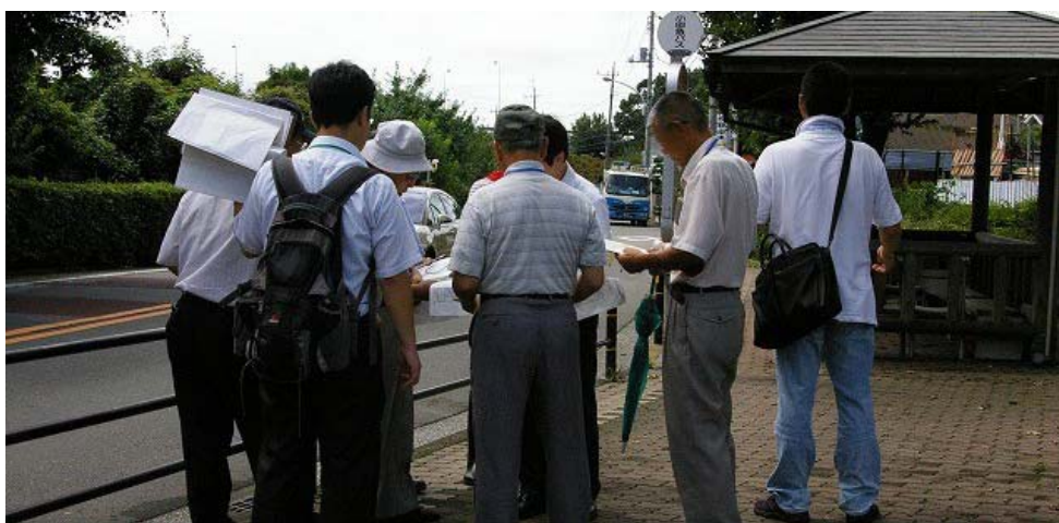
(写真4) グループに分かれて現地を見学