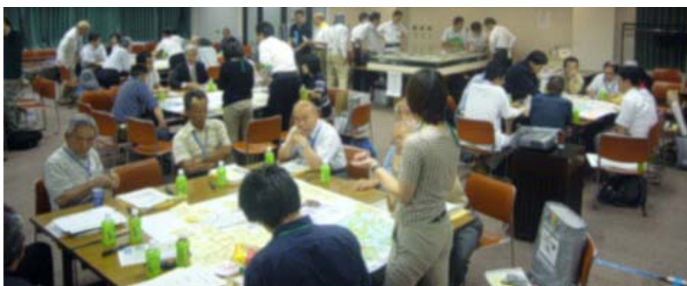
(写真1) 5つのグループに分かれて検討