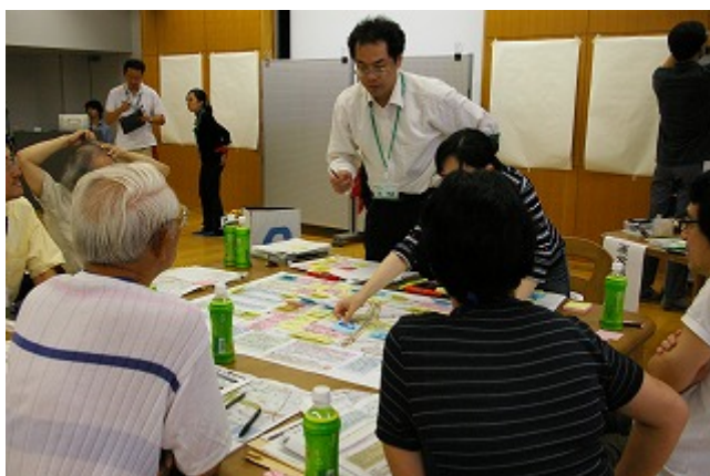
(写真5) 図面の資料を使って検討