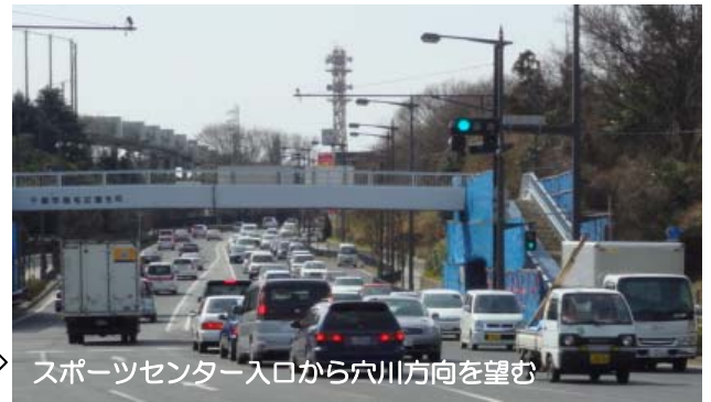
スポーツセンター入口から穴川方向を望む