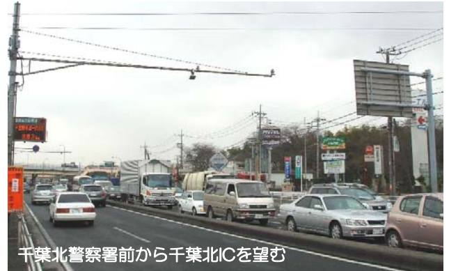
千葉北警察署前から千葉北ICを望む