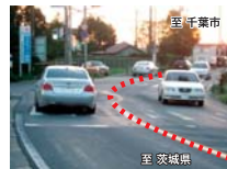
カーブ区間内の権現前交差点 (千葉県方面を望む)