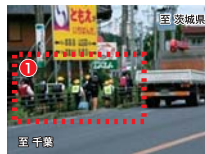
通学路上の狭い歩道の状況 (桜田小～権現前交差点付近)

当該区間は、小・中学校の通学路に指定されている区間であるが、歩道が1m程度しかない狭い箇所が点在しており歩行者の安全性に問題があります。また、カーブ区間が連続しており、特に権現前交差点はカーブ区間内であることから交通事故が多発しています。大栄拡幅の整備により、歩道幅員が広くなるとともに道路線形の見直しにより良好な道路空間の確保が期待できます。