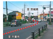
カーブ区間内の権現前交差点 (茨城県方面を望む)